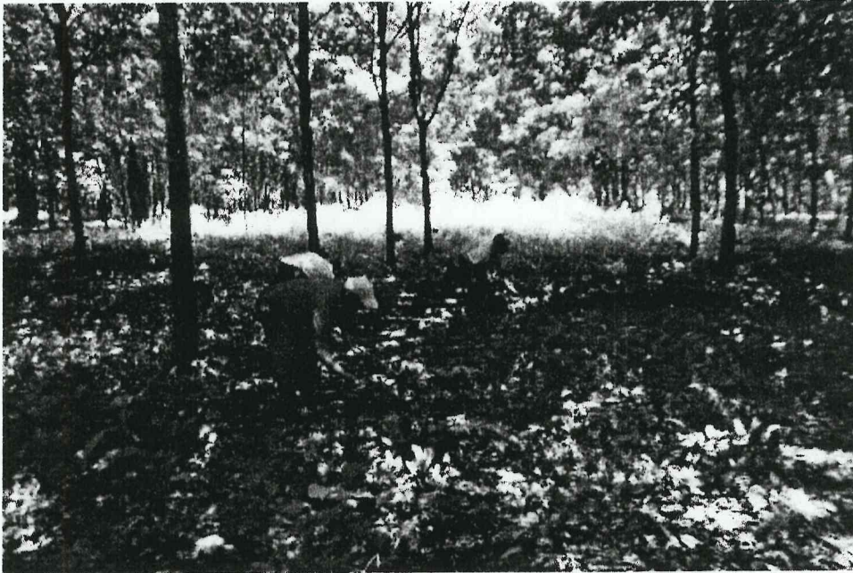
Imagen 1. Ubicación y Limpieza del área para las nuevas operaciones (Espigares 2015)