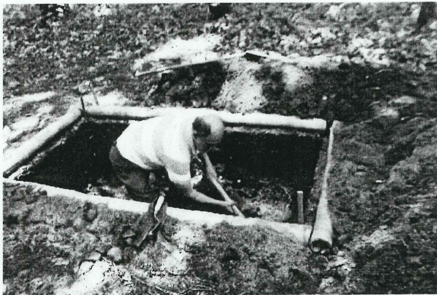
Imagen 2. Proceso de excavación en Op. NN-16a (Espigares 2015)