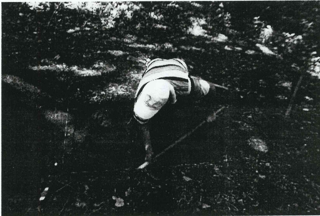
Imagen 5. Proceso de excavación en Op. AA-16a (Espigares 2015)