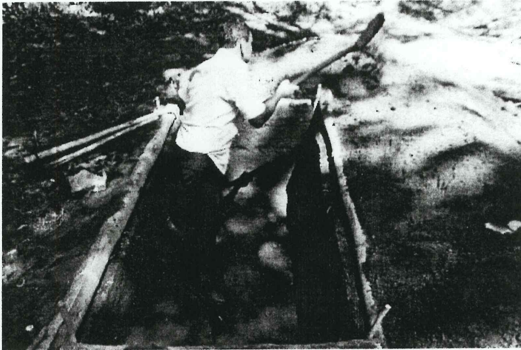
Imagen 3. Proceso de excavación en Op. MM-14a (Espigares 2015)