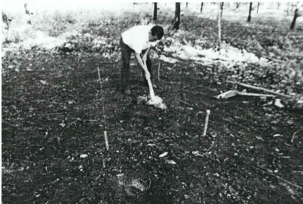
Imagen 4. Proceso de excavación en Op. CC-16a (Espigares 2015)